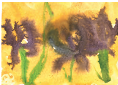
«Мамочка, я тебя люблю и поздравляю с праздником» Илья ПАРАХИН, 6 лет