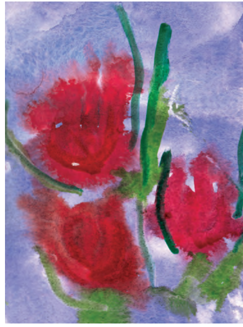
«Я дарю маме красивые цветы» Атрощенко ПОЛИНА, 4 года