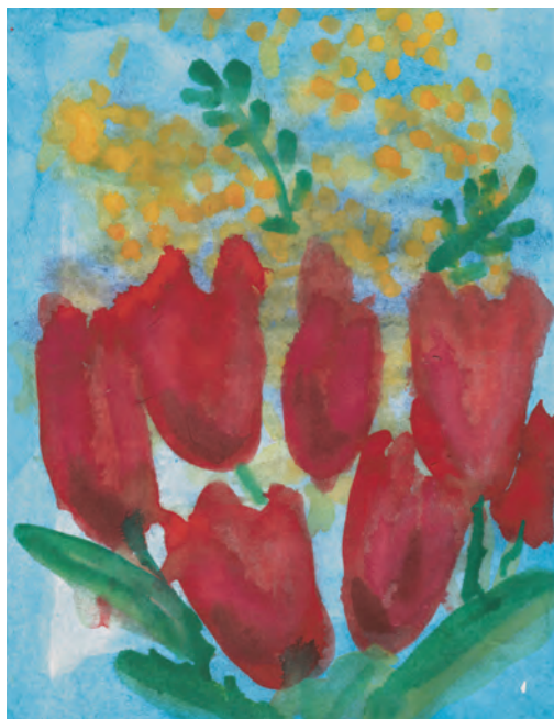
«Дорогая мамулечка, ты самая хорошая и красивая» Маша КОЗЛОВА, 5 лет