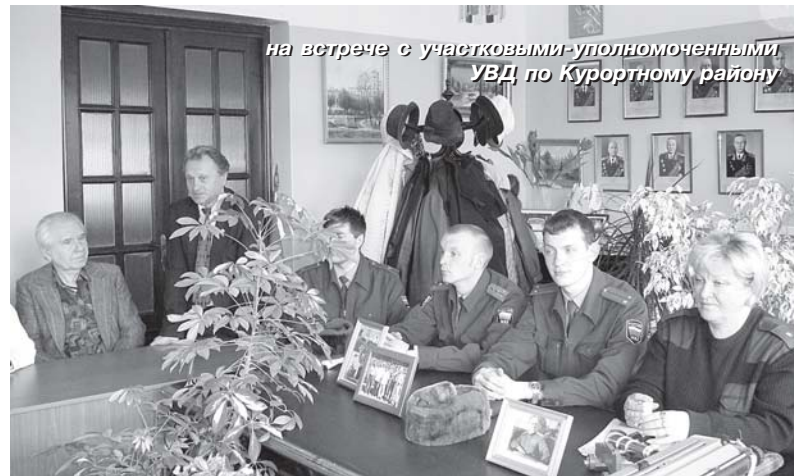
на встрече с участковыми уполномоченными УВД по Курортному району

Осознавая важность поставленных задач по профилактике правонарушений и соблюдения порядка на территории города Сестрорецка, депутаты Муниципального совета приняли решение об установке на улице Токарева камер видеонаблюдения. Как показывает практика, наличие видеонаблюдения существенно снижает показатели правонарушений в местах их установки.