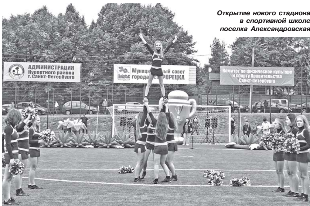
Открытие нового стадиона в спортивной школе поселка Александровская

Всего в 2009 году при поддержке Муниципального совета города Сестрорецка состоялось 16 спортивных соревнований, на проведение которых затрачено 1217,2 тыс. рублей.