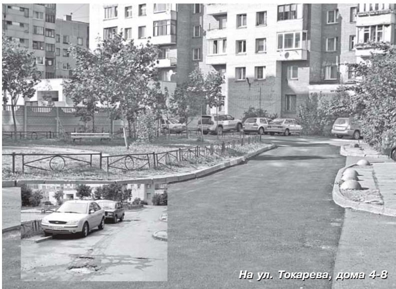
На ул. Токарева, дома 4-8

Продолжается работа по оборудованию спортивных площадок для подростков и молодежи. Опыт предыдущих лет по-