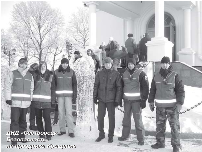
ДНД «Сестрорецк - Безопасность» на празднике Крещения

Одновременно с установкой игровых и спортивных площадок восстанавливаются газоны, разбиваются цветники, высаживаются деревья и декоративные кус-