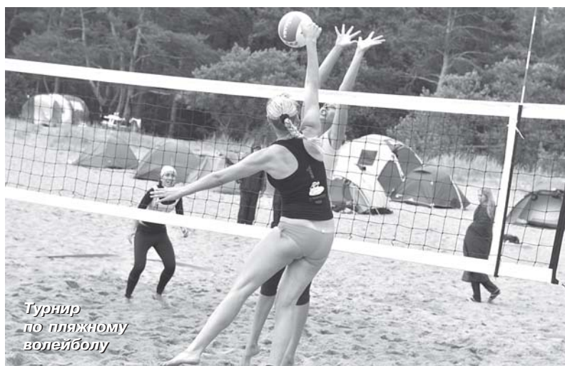
Турнир по пляжному волейболу