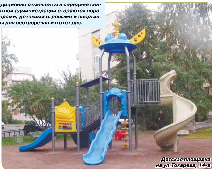
Детская площадка на ул. Токарева, 14-а