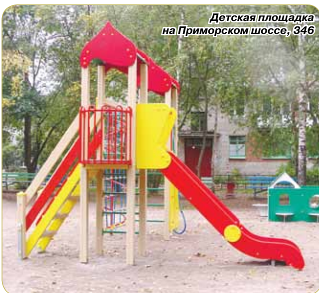
Детская площадка на Приморском шоссе, 346

Ежегодно ко Дню основания Сестрорецка, который традиционно отмечается в середине сентября, депутаты Муниципального совета и служащие Местной администрации стараются порадовать горожан новыми объектами благоустройства, скверами, детскими игровыми и спортивными площадками. Замечательные подарки приготовлены для сестроречан и в этот раз.