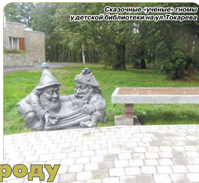
Сказочные «ученые» гномы у детской библиотеки на ул. Токарева