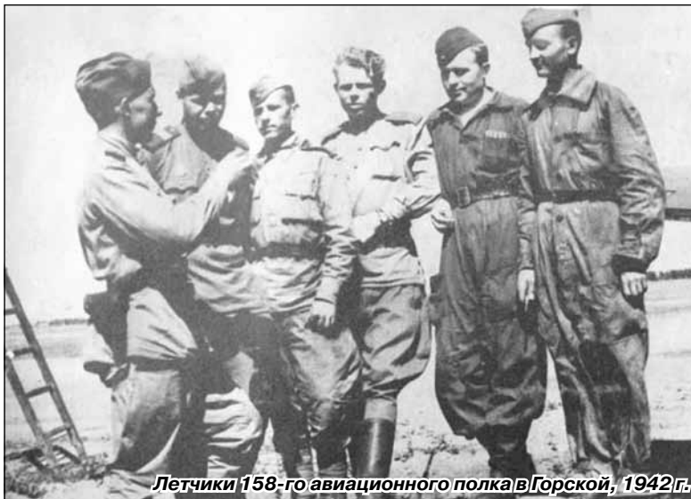
Летчики 158-го авиационного полка в Горской, 1942 г.

Рядом с настоящим аэродромом, ближе к Лисьему Носу, был построен фальшивый, с целью дезориентировать противника. На летном поле стояли «самолеты» из фанеры, это были муляжи, изготовленные в цехе театральных декораций на улице Писарева в Ленинграде. Обманный аэродром несколько раз подвергался массовой бомбардировке, тем самым, спасая настоящий аэродром.