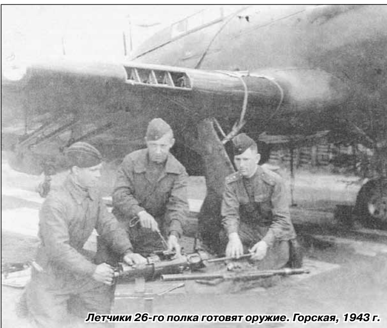
Летчики 26-го полка готовят оружие. Горская, 1943 г.