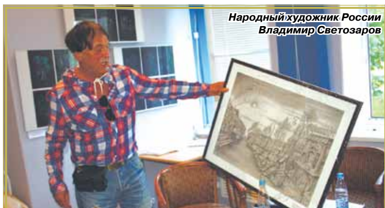
Народный художник России Владимир Светозаров