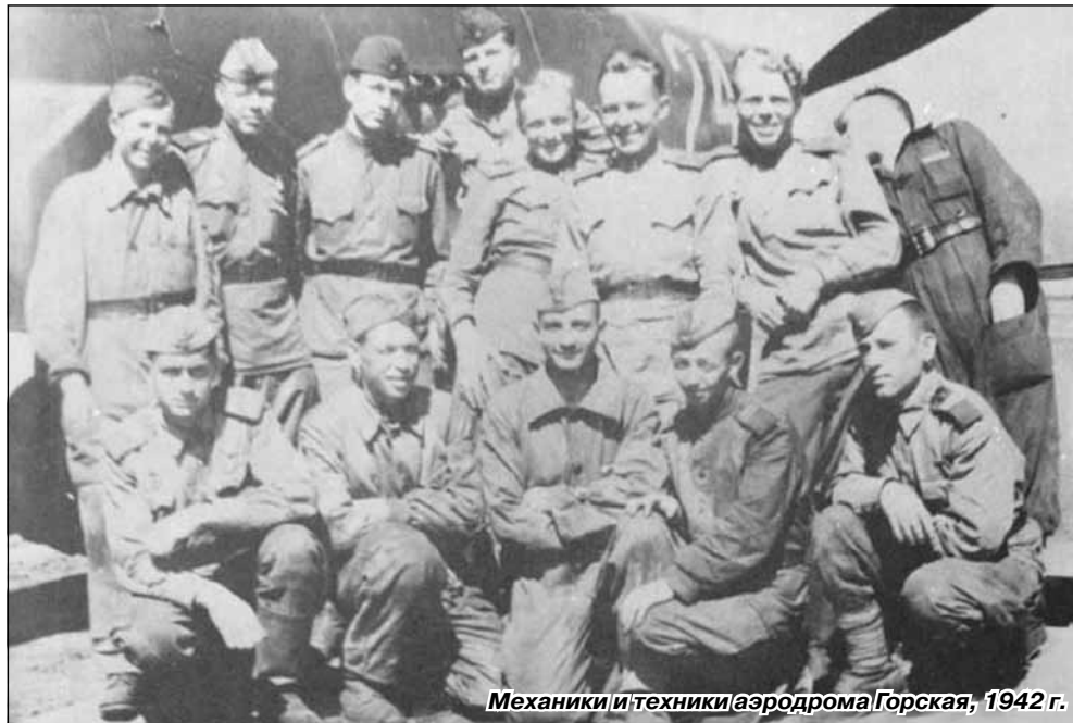
Механики и техники аэродрома Горская, 1942 г.