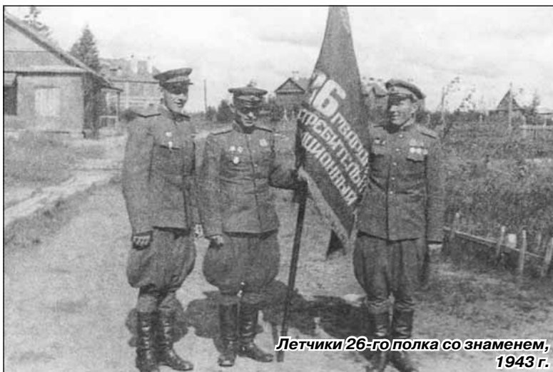
Летчики 26-го полка со знаменем, 1943 г.