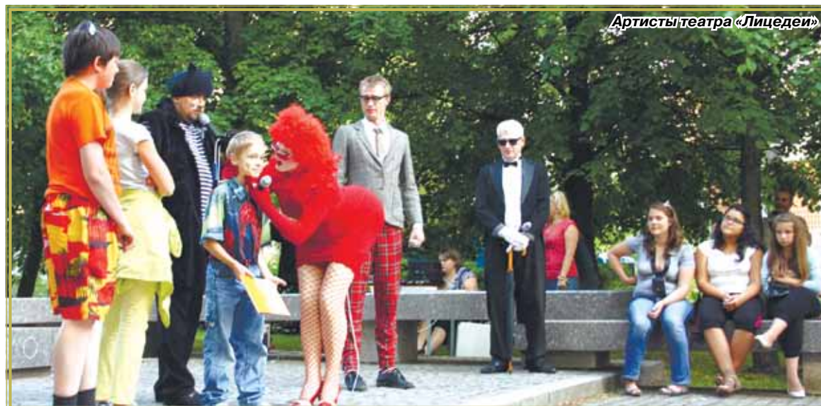
Артисты театра «Лицедеи»