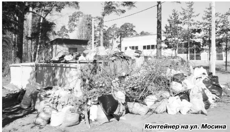
Контейнер на ул. Мосина

ледяные торосы). Проблемы начались после первоапрельского пояснения Контрольно-счетной палаты Санкт-Петербурга о том, что существующая система сбора и утилизации мусора из зон застройки ИЖС не соответствует федеральным законам и пред-