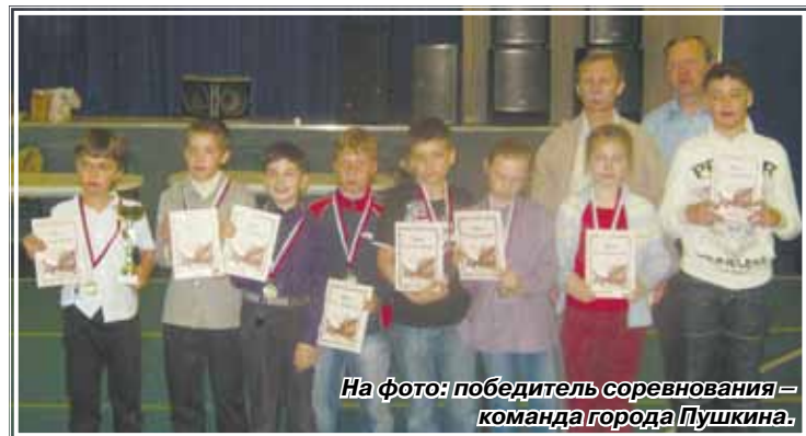
На фото: победитель соревнования – команда города Пушкина.

В Петербурге набирает популярность детский шахматный турнир под названием кубок городов-спутников. Сначала соревнования проводились в Колпино. В прошлом году эстафету подхватил Петергоф. А в этом – очередной этап принял Сестрорецк. 22 мая в парк «Дубки» приехали юные шахматисты из Петергофа, Красного Села, Пушкина, Кронштадта. Впервые за все время проведения турнира выставил свою команду и Сестрорецк. В каждой команде было по 5 мальчиков