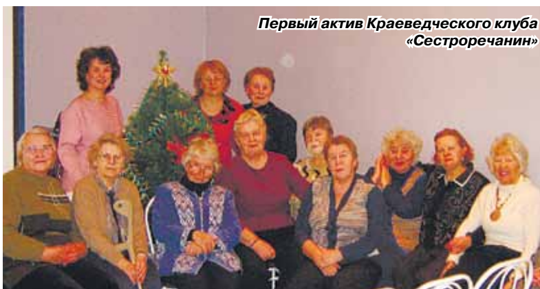
Первый актив Краеведческого клуба «Сестроречанин»