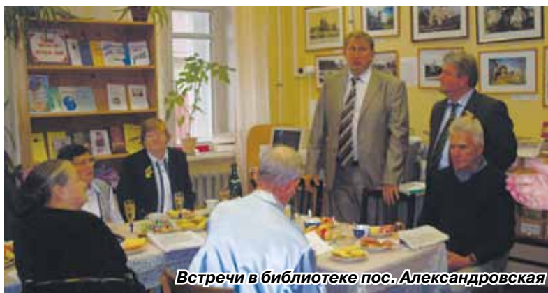
Встречи в библиотеке пос. Александровская