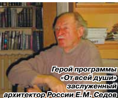
Герой программы «От всей души» заслуженный архитектор России Е.М. Седов