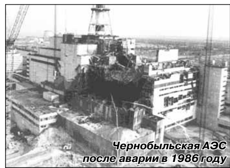
Чернобыльская АЭС после аварии в 1986 году