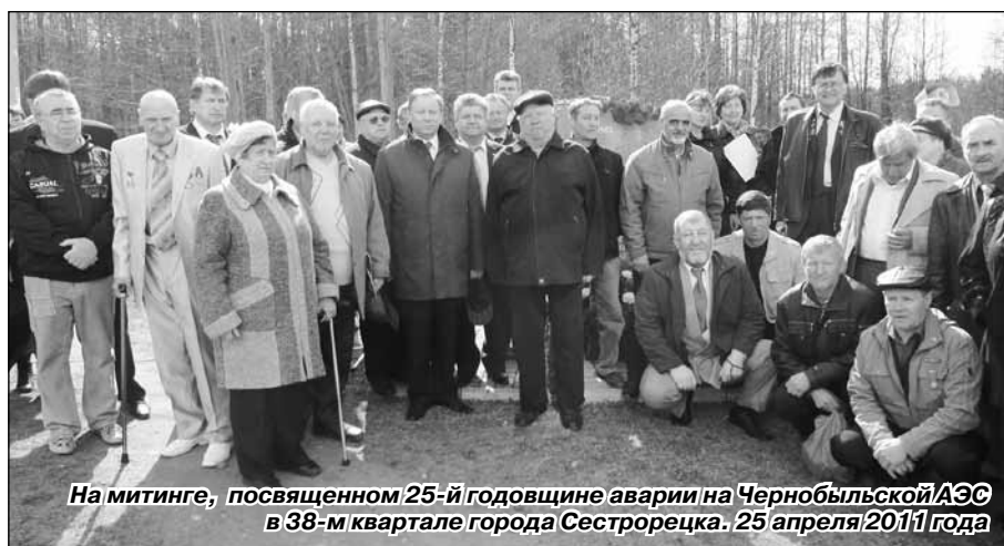
На митинге, посвященном 25-й годовщине аварии на Чернобыльской АЭС в 38-м квартале города Сестрорецка. 25 апреля 2011 года

квартале города Сестрорецка. Ими создано и активно действует районное отделение общественной организации инвалидов «Союз «Чернобыль» России. Координационный орган – Совет районного отделения был создан в 2002 году для консультирования членов организации по различным вопросам, оказания им юридической поддержки, защиты прав «чернобыльцев» в судах. За это время членами организации было выиграно более 100 судебных процессов по соблюдению норм федерального законодательства о защите граждан, пострадавших при ликвидации аварии на Чернобыльской АЭС.