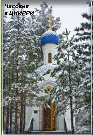
Часовня в ЦНИРРИ

ти. В наше прагматичное время сделать доступным и популярным среди местного сообщества краеведческое знание не так просто, тем более среди молодежи. И это, несмотря на то, что краеведением занимаются образовательные учреждения, учреждения культуры, исследователи – краеведы. Муниципальными советами Сестрорецка, Зеленогорска, Песочного и других муниципальных образований издаются краеведческие издания. И, когда наши дети попадают на такие встречи, как правило, их интерес неподделен.