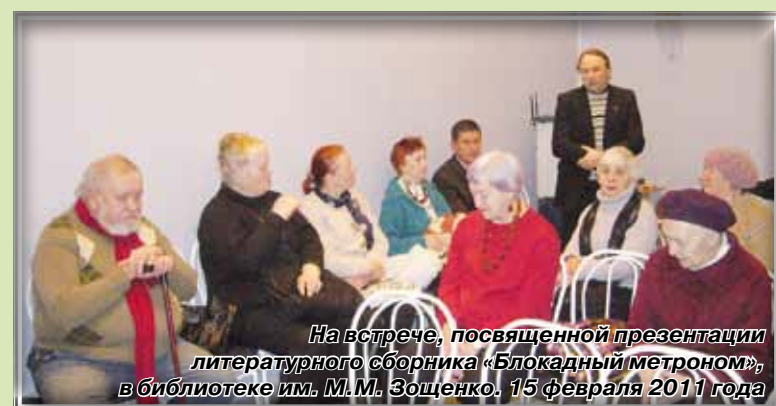
На встрече, посвященной презентации литературного сборника «Блокадный метроном», в библиотеке им. М.М. Зощенко, 15 февраля 2011 года

Сложная это вещь – история, и одновременно – простая. Она отпечатывается на ленте времени глобальными событиями, а складывается из судеб отдельных людей, семей, а порой и кратких эпизодов их жизни.