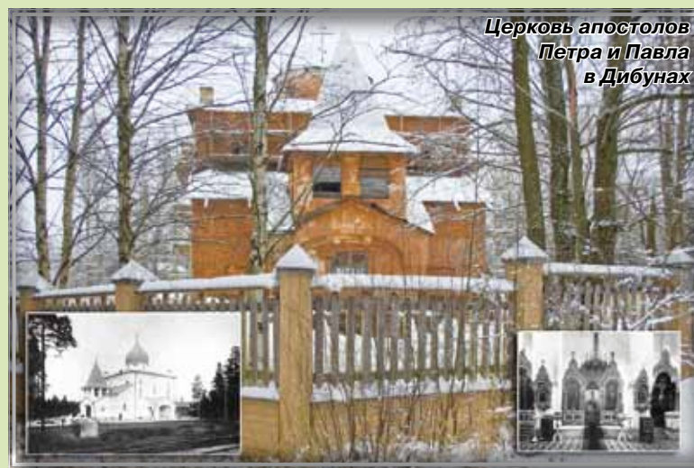
Церковь апостолов Петра и Павла в Дибуну