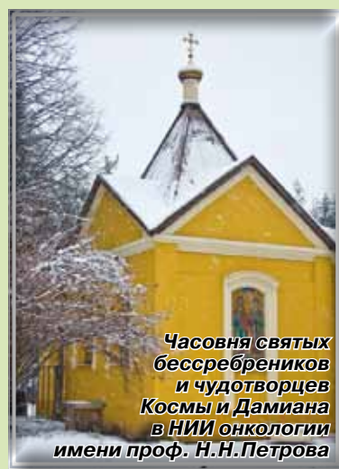
Часовня святых бессребреников и чудотворцев Космы и Дамиана в НИИ онкологии имени проф. Н.Н.Петрова