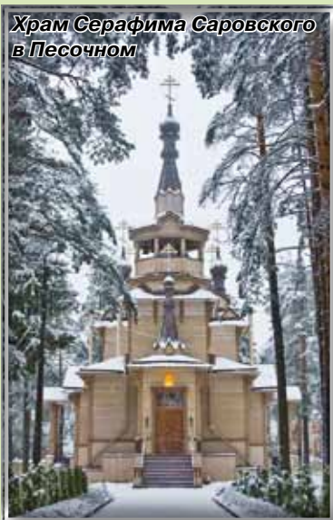
Храм Серафима Саровского в Песочном