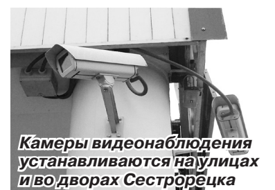
Камеры видеонаблюдения устанавливаются на улицах и во дворах Сестрорецка

В 2010 году удалось провести обучение 204 неработающих жителей Сестрорецка способам защиты и действиям в чрезвычай-