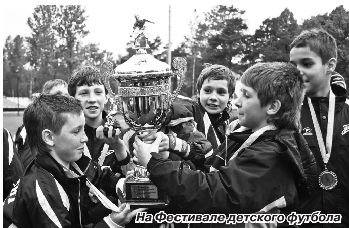
На Фестивале детского футбола

Развитие спорта и здорового образа жизни – важное направление деятельности депутатов Муниципального совета и служащих Местной администрации. Поддержка детских и взрослых команд по самым разным видам спорта становится стимулом для спортивных побед наших земляков. В 2010 году были полностью организованы или прошли при значительной организационно-материальной поддержке из средств местного бюджета 44 турнира и соревнования по различным видам спорта.