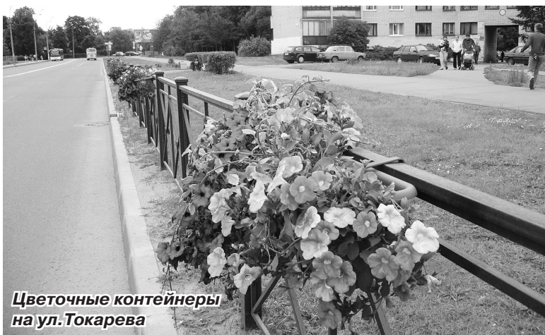
Цветочные контейнеры на ул. Токарева

Всего в 2010 году высажено 507 кустарников и 3760 цветов. На адресную программу по озеленению придомовых территорий и территорий дворов Сестрорецка в прошедшем году израсходовано более 3,9 млн. руб.