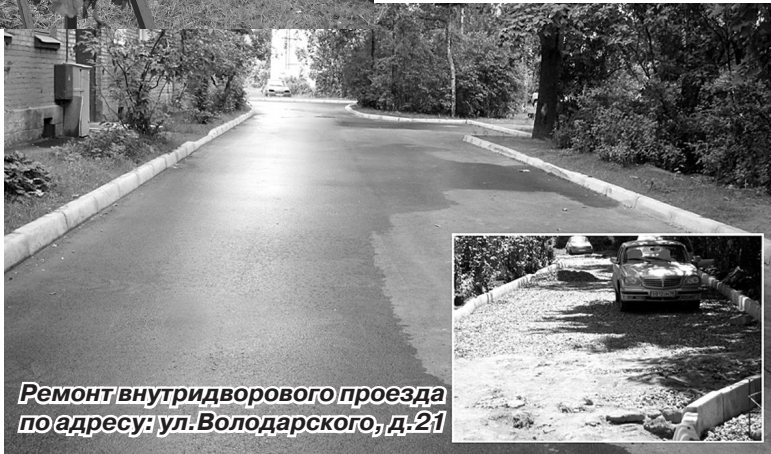
Ремонт внутридворового проезда по адресу: ул. Володарского, д.21