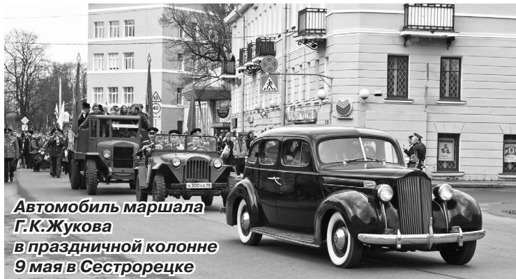
Автомобиль маршала Г.К.Жукова в праздничной колонне 9 мая в Сестрорецке

В августе традиционно отмечался День поселка Разлив, проведение которого несколько лет назад было инициировано самими жителями. Также успешно состоялись и знаменитые «Зощенковские чтения», в 2010 году благодаря Муниципальному совету, их участником стал Народный артист России А.Г.Филиппенко.