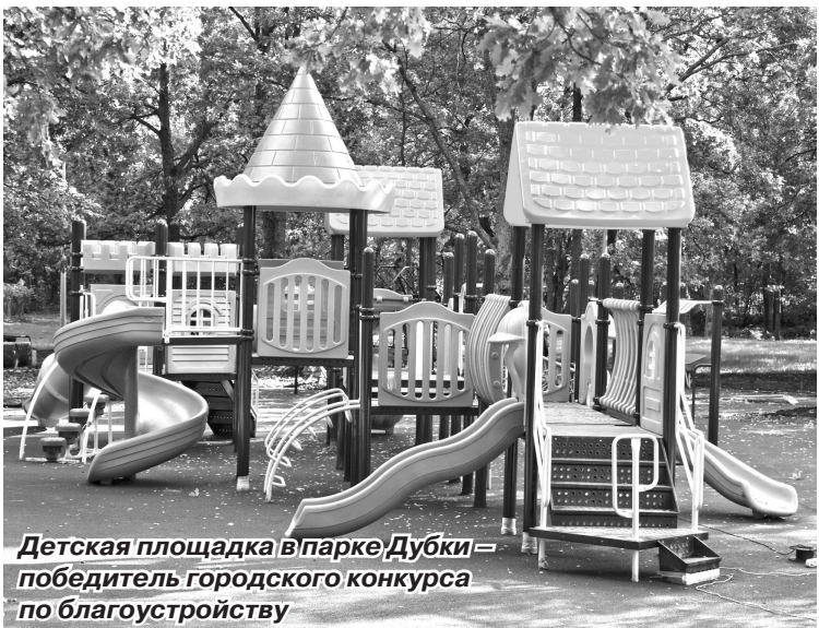
Детская площадка в Парке Дубки – победитель городского конкурса по благоустройству

Улицы Сестрорецка украшались к праздничным мероприятиям, посвященным Новому году, Дню Победы, Дню основания Сестрорецка и другим. Световые гирлянды и баннеры, декоративное освещение фасадов – все это помогает поднять настроение сестрорецким в праздничные дни. К Рождеству Христову хорошим подарком для верующих горожан стали ледяные фигуры ангелов, которые были установлены у входов в храм апостолов Петра и Павла и церковь в пос.Александровская.