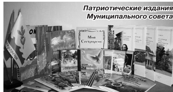
Патриотические издания Муниципального совета

Муниципальным советом налажено сотрудничество с военно-патриотическим клубом «Сестрорецкий рубеж». В июне и сентябре при организационно-финансовом участии органов местного самоуправления у ДОТа на 37 км Приморского шоссе проводились военно-