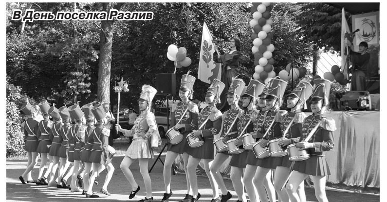
В День поселка Разлив

Стало хорошей традицией чествовать супружеские пары,