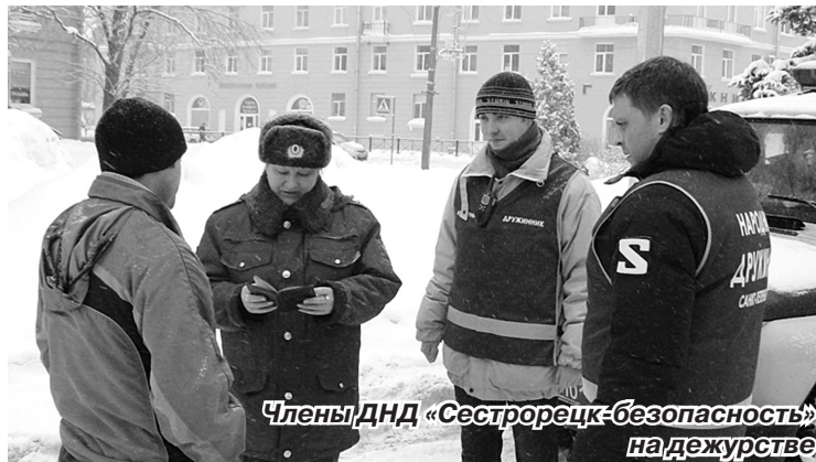
Члены ДНД «Сестрорецк-безопасность» на дежурстве

Были установлены 2 шлагбаума, ограничивающих доступ автотранспорта (ул.Володарского, д.9, магазин «Полушка» и у въезда на пляж Северный).